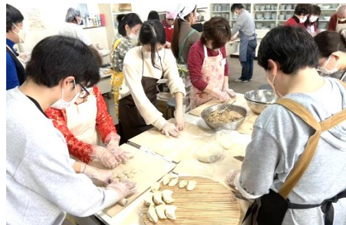
春節餃子会の様子

「中日友好 千年萬年」(廖承志氏揮毫) 記念碑建立45周年 ジャイアントパンダ「永明」32才(2024.9.14)誕生日を記念して撮影