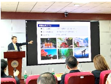
山東大学での記念講義

また、7月には知事及び県議会、県日中友好協会、大学関係者等の官民総勢約30名で同省を訪問し、同省書記と会談をおこなった他、山東大学で記念講義を行うとともに、大衆日報社において記念インタビューを受けました。