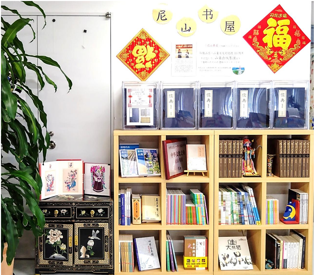
センター図書コーナーの「尼山書屋」