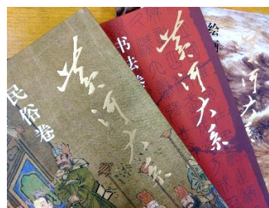
「黄河大系」シリーズ (全20冊) 発行:山東出版集団 (山東友誼出版社)