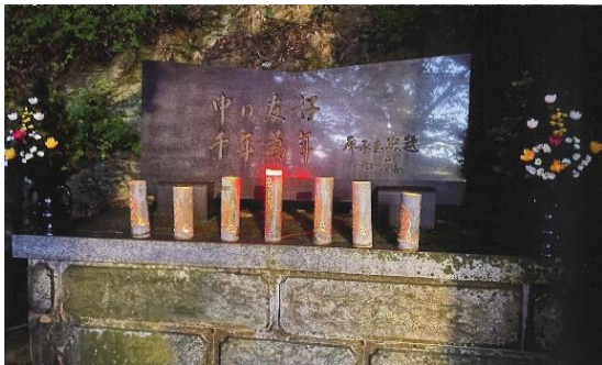
紀三井寺でのイベントの様子

毎年、旧正月の春節には留学生の皆さんと餃子をつくって水餃子を食べる「春節餃子会」を開催しています。